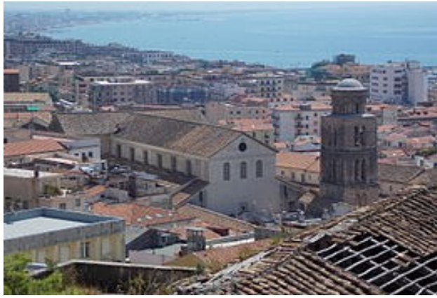
Vista della Cattedrale dal centro storico alto